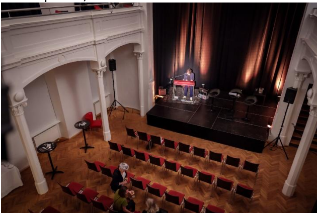
60 Sitzplätze, Publikumpodesterie